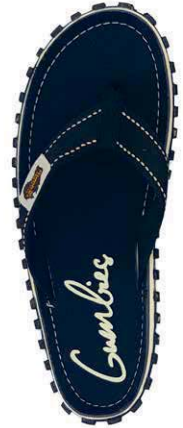
Black Style # G/IS/BL