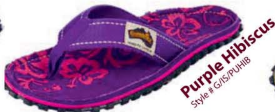
Purple Hibiscus Style # G/IS/PUHIB