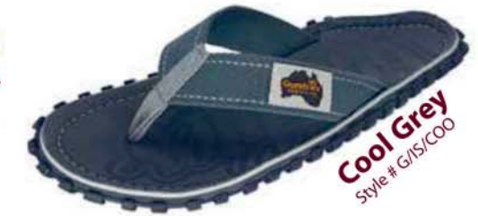
Cool Grey Style # G/IS/COO