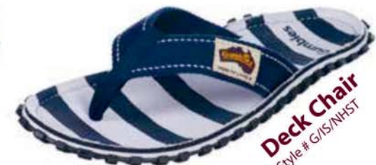
Deck Chair Style # G/IS/NHST