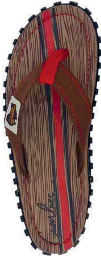
Woody Style # G/IS/WOO