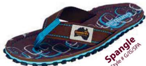
Spangle Style # G/IS/SPA