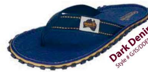
Dark Denim Style # G/IS/DDEN