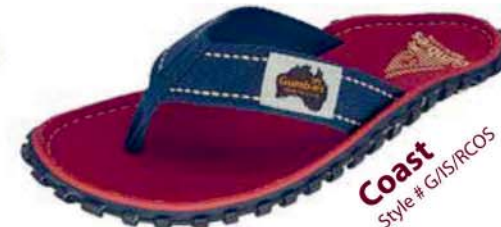
Coast Style # G/IS/RCOS