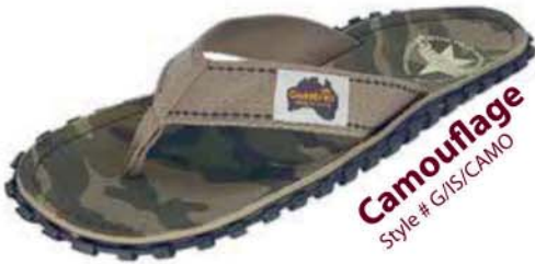
Camouflage Style # G/IS/CAMO