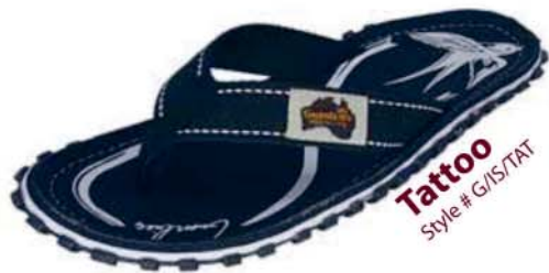
Tattoo Style # G/IS/TAT