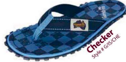
Checker Style # G/IS/CHE