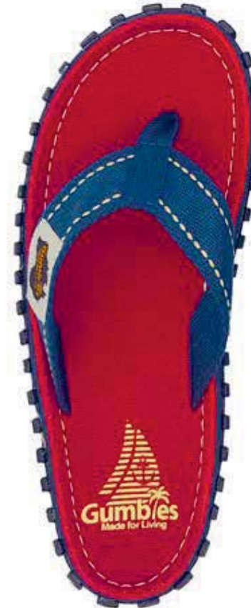
Coast Style # G/IS/RCOS