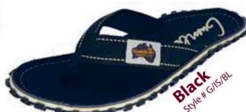
Black Style # G/IS/BL