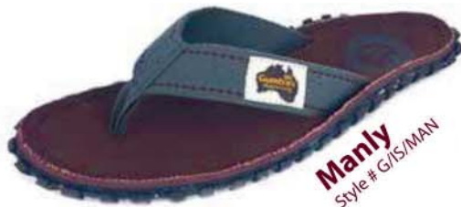
Manly Style # G/IS/MAN