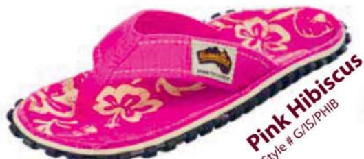
Pink Hibiscus Style # G/IS/PHIB