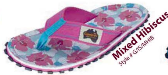
Mixed Hibiscus Style # G/IS/MHIB