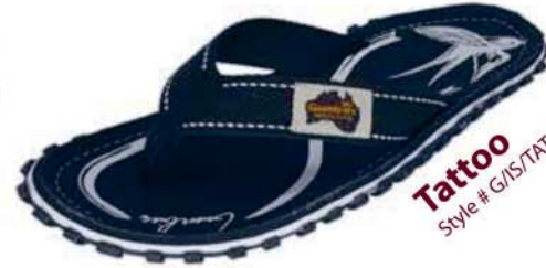
Tattoo Style # G/IS/TAT