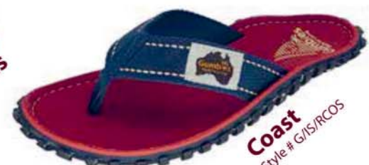
Coast Style # G/IS/RCOS