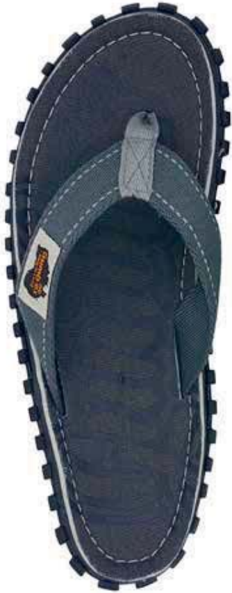
Cool Grey Style # G/IS/COO