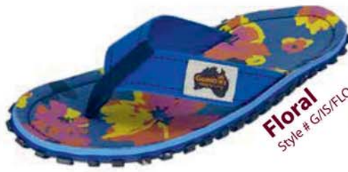
Floral Style # G/IS/FLO