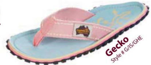
Gecko Style # G/IS/GHE