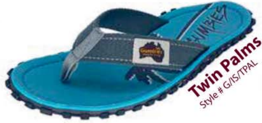
Twin Palms Style # G/IS/TPAL