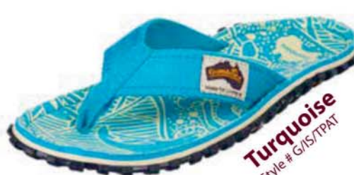
Turquoise Style # G/IS/TPAT