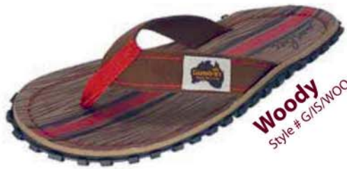
Woody Style # G/IS/WOO