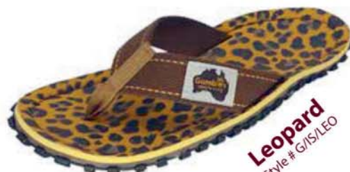
Leopard Style # G/IS/LEO