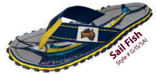
Sail Fish Style # G/IS/SAI