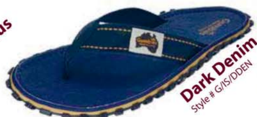
Dark Denim Style # G/IS/DDEN