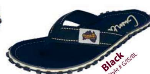
Black Style # G/IS/BL