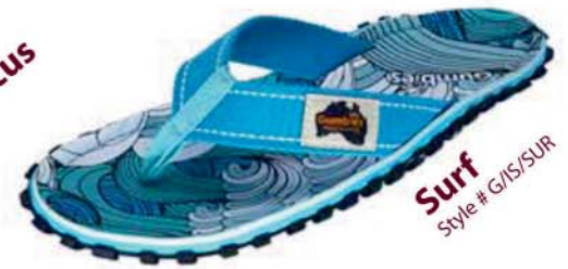
Surf Style # G/IS/SUR