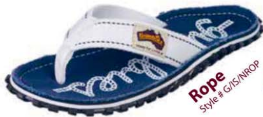
Rope Style # G/IS/NROP