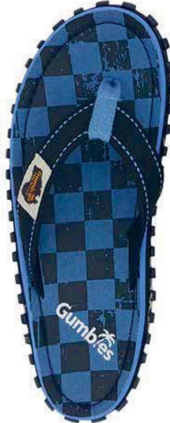
Checker Style # G/IS/CHE